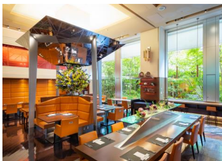
ダイニング 流 店内イメージ